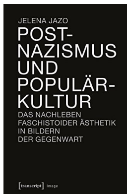
Cover: Postnazismus und Populärkultur