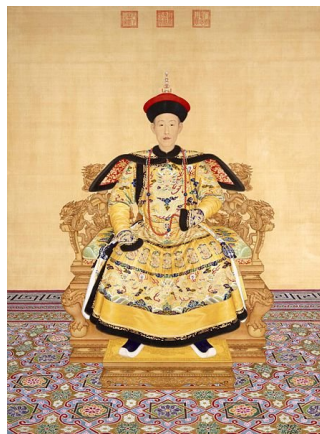
Abb. 6: The Qianlong Emperor in court dress

Schon die erste Sentenz Ransmayrs markiert mit großer rhetorischer Kraft - etwa durch die Kombination der klassischen Metonymie der "Segeln" und der Alliteration, die sich durch ihre "Schlaffheit" ergibt - das zentrale Thema des Verhältnisses von Zeit, Wissen und Macht. Denn dass die Steuerbeamten sich gegen den Herrn der Zeit gestellt haben, führt in dessen Autokratie zur direkten Bestrafung ihrer Körper, die auf den 303 Seiten - gemäß der Rechtsgeschichte des 18. Jahrhunderts - auch in weiteren Fällen akribisch beschrieben wird, um die allumfassende und brutale Herrschaft des chinesischen Souveräns und seiner Scharfrichter zu erfassen.