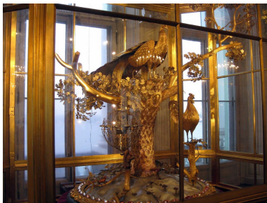
Abb. 2. The Peacock Clock

Derartige Automaten faszinierten die aristokratischen Höfe des 18. Jahrhunderts von Russland bis nach China, weshalb Cox aus dieser Nachfrage ein florierendes Geschäft machen konnte. Heute sind seine Wundermaschinen in verschiedenen Museen der Welt zu sehen. Die berühmteste findet sich wohl in der Eremitage, da Grigori Alexandrowitsch Potjomkin (* 1739; † 1791) Katharina II. (* 1729; † 1796) dazu bringen konnte, eine Pfauenuhr bei Cox zu erstehen, deren Faszination bis heute in der Frage besteht, wie es zu diesem Zeitpunkt technisch möglich war, durch die Mechanismen von Uhrwerken die Blicke einer Eule, das Krähen eines Hahnes und das Auffächern eines Pfauenrads mechanisch nachzuahmen (virtuell sichtbar mit einem Klick auf das Bild):