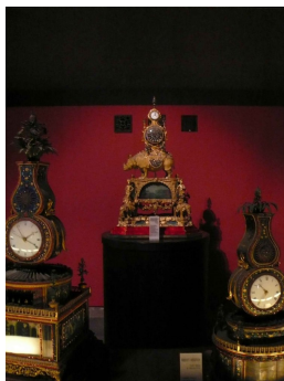
Abb. 3: Haus der Uhren in der Verbotenen Stadt

"Auch die Uhrmacher, auch die Automatenbauer sollten gemeinsam mit dem Hof in den Sommer ziehen. Denn die Arbeit an den Uhren mußte schließlich in der wohlwollenden Nähe des Kaisers weitergeführt werden und nicht in der fernen Hauptstadt, in der irgendeine unvorhergesehene Störung, Materialmangel oder eine fremdenfeindliche Intrige der Zulieferer sie behindern konnte." (174)