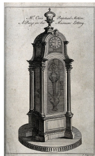
Abb. 4: The Perpetual Motion