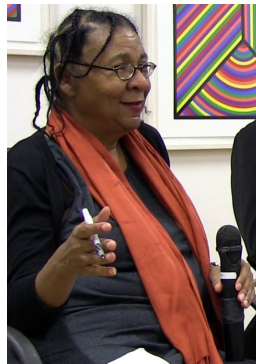
bell hooks im Oktober 2014

Man kann Kazeem-Kami?skis in vier Kapitel gegliedertes Buch (plus Einleitung und Ausblick) linear lesen und begegnet dann (1) einer Biografie von bell hooks, (2) einem Abschnitt zu den Hintergründen und Einflüssen der hooks'schen Theorie, (3) einer Auseinandersetzung mit hooks' engagierten Pädagogik, (4) sowie einem Kapitel, das sich mit Theorie als befreiender Praxis beschäftigt. Man kann Kazeem-Kami?skis Monografie aber auch punktueller lesen - es gewissermaßen als Nachschlagwerk benutzen. Denn die einzelnen Kapitel werden von kurzen, "Stichwort" genannten Abschnitten durchbrochen, in denen wichtige Begriffe und Theorien erläutert werden, die insbesondere für LeserInnen relevant sein dürften, die mit hooks' Schwarzem Feminismus im Allgemeinen und ihrer engagierten Pädagogik im Besonderen nicht vertraut sind. Die Kapitel werden zudem von Info-Kästchen ergänzt, in denen die Autorin Literatur- und Anspieltipps versammelt, die mir vor allem für LeserInnen relevant zu sein scheinen, die das beim Lesen von Kazeem-Kami?skis Buch erworbene Wissen noch vertiefen wollen - sei es durch weitere Lektüren oder durch die Auseinandersetzung mit Gesprächen und Vorträgen von bell hooks, die das world wide web bereit hält. Auch diejenigen, die mit dem Werk von bell hooks vertraut sind, entdecken in den Kästchen, die Kazeem-Kami?ski zusammen gestellt hat, wohl noch einige Schätze.