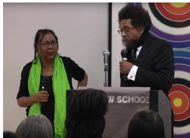
bell hooks & Cornell West