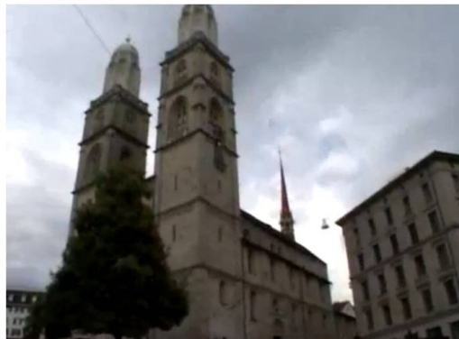
Abb. 2: Johannes Gees: SALAT 2007. Zunächst in Bern, später in Zürich und St. Gallen wurden umgebaute, mit MP3-Player und Timer bestückte Megaphone auf Kirchtürmen platziert. Zu regelmäßigen Zeiten schallte daraufhin das Gebet des Muezzins durch die Schweizer Innenstädte.