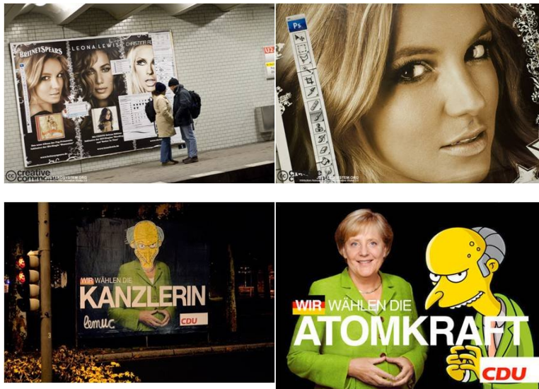
Abb. 3-6: Streetart und Adbusting. Oben: Digital Natives haben Interface-Paletten der Bildbearbeitungssoftware Photoshop auf Werbeplakate für die neusten Alben von Britney Spears, Leona Lewis und Christina Aguilera geklebt. Unten: Manipuliertes Wahlplakat zur Bundestagswahl 2009: Montgomery Burns, Kunstfigur aus der TV-Serie "The Simpsons" ist bekannt für seine typische Handhaltung, seinen grünen Anzug und seine Haltung zur Atomkraft (weitere Beispiele zum Cultural Hacking: siehe http://culturalhacking.wordpress.com [letzter Zugriff: 19.06.2014]).