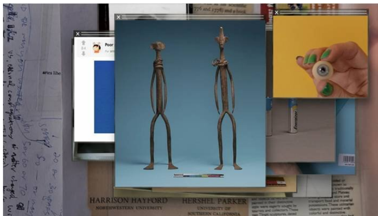
Abb. 13-15: Camille Henrot, La GrosseFatigue, 2013. Postproduction der Geschichte des Universums: mit Hip-Hop-