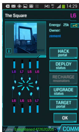
Abbildung 2: Screenshot eines Portals in "Ingress"

Befindet man sich in der wirklichen Welt samt Smartphone und aktivierter "Ingress"-App in der Nähe einer Sehenswürdigkeit samt aktivem Portal, serviert das Spielprinzip eine Hand von Interaktionsmöglichkeiten. An vorderster Front steht das so genannte "Hacken" von Portalen, welche mit dem aus "World of Warcraft" bekannt gewordenen "Farmen" von dringend benötigten Spielmaterialien resultiert. "Farming" erfolgt bei "Ingress" insofern, als SpielerInnen in Folge sämtlicher erfolgreichen Hacking-Aktionen mit entscheidenden Gegenständen belohnt werden, welche den Spielfortschritt vorantreiben. Jedes Mal wenn SpielerInnen ein Portal erobern möchten, funktioniert dies mit den so genannten "XMP-Bursters". Als einziges Interaktionselement fungieren diese "burster" als Waffen, da sie über Offensivkapazität verfügen und feindliche Portale zerstören können. Ähnlich wie beim Charakter-Level des Alter-Egos aller "Ingress"-SpielerInnen der Fall, verfügen sowohl Angriff- als auch Defensiv-Mechanismen (z. B. "Resonators") über unterschiedliche Wirkungsgrade ("Level") und verbrauchen unterschiedlich viel Energie ("XM").