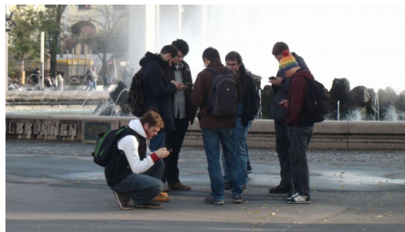
Abbildung 1: Ingress-SpielerInnen am Wiener Schwarzenbergplatz

Das Alleinstellungsmerkmal ist gleichzeitig auch das beste Heilmittel für bzw. gegen notorisches "Couch-Potatoeing". Zwar dreht sich in "Ingress" alles rund um die spieleigenen Symbole und Aktionen, welche auf dem Display des Smartphones in funktionaler Grafik dargestellt werden, doch sobald das Spiel per App am Smartphone gestartet wird, erfordern Spielrahmen und Ziele des Draußenspiels stets die physische Anwesenheit der SpielerInnen vor Ort. Das Spielfeld ist daher grundsätzlich die gesamte Welt. Smartphone und App bilden lediglich die Brille, welche den virtuellen Kampf rund um Portale und der geheimnisvolle Energiematerie, sichtbar macht. Diese Tore sind spielerischer Dreh- und Angelpunkt, weil sie Quellen für besagte Energie sind. In der wirklichen Welt sind "Ingress"-Portale meist an markanten Punkten platziert: klassische Touristen-Attraktionen, wie in Wien der Stephansdom oder das Hundertwasserhaus, Verkehrsknotenpunkte wie Wien Mitte oder - sonstige hervorstechende Erlebnisstätten wie die Wasserspiele am Schwarzenbergplatz, der Startpunkt des "Magnus13"-Events.