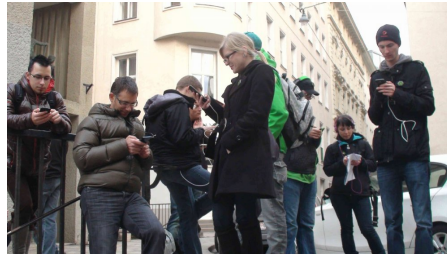
Abbildung 3: Ingress-SpielerInnen agieren im medialen und sozialen Raum

tatsächlich nach Niederösterreich fahren müssen, um dortige Portale einnehmen zu können. Trotz des vordergründigen - an den Kalten Krieg erinnernden und klar definierten - Konflikts zwischen zwei klar abgegrenzten Großmächten, steht die Freude am gemeinsamen Spiel im Mittelpunkt. Der strategische Feldzug mittels territorialer Besetzung à la "Risiko" ist ein durchaus interessanter Aspekt und bereichert "Ingress"; de facto schiebt jedoch das Game-Design der reellen und dem Spielspaß wenig zuträglichen Umsetzung von globaler Dominanz, durch einer der beiden Konfliktparteien, einen Riegel vor: "ingress wird niemals von einer Partei gewonnen werden - das lässt schon der spielalgorithmus nicht zu. die hauptsache ist eine menge spaß in einer guten [...] Community" [5] , so ein Forenkommentar vom 18.11.2013 im Zuge eines Online-Artikels rund um den ersten Österreichischen "Ingress"-Event in Wien am 16.11.2013.