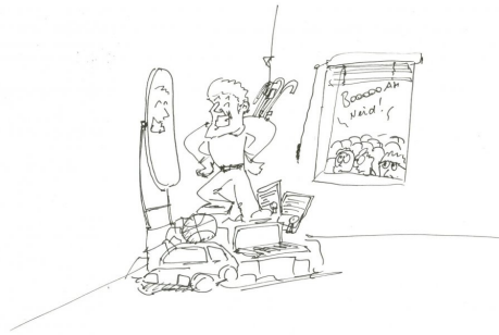
Abb. 1 [Der "absolute Übertyp"]

Ein starkes Bedürfnis nach Selbstinszenierung zeigt sich unverkennbar in diesem Bild eines 29-jährigen Netzakteurs aus Österreich.