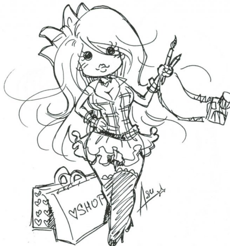
Abb.2 ["Aufgebretzelt mit hübschen Klamotten und mit hübschem Make up und ich hab' in der Hand einen Pinsel und Stifte und eine Fotokamera"]