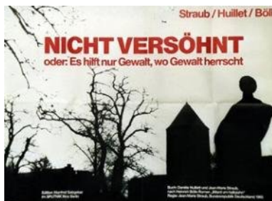
Abb. 3: Jean-Marie Straub (1965): Nicht versöhnt - Deutsches Filmplakat © Produktion Straub-Huillet

Das Wort erhebt sich in die Lüfte, während zur gleichen Zeit die Erde, die man sieht, immer tiefer sinkt. Oder besser: Während sich dieses Wort in die Lüfte erhebt, sinkt das, wovon es spricht, unter die Erde.