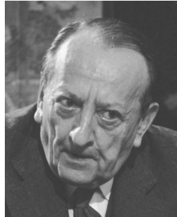
Abb. 5: André Malraux

wie manchmal die nötige Bildung fehlt, um irgendeine Beziehung zur Kunst zu haben? Ich weiß es nicht. Malraux entwickelt einen schönen philosophischen Begriff; er sagt etwas sehr Einfaches über die Kunst, er sagt, sie sei das einzige, was dem Tod widerstehe.