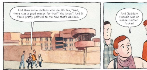
Abb. 4: Strip aus der englischen Version von "Im Schatten des Krieges"