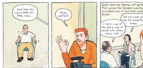
Abb. 2: Strip aus der englischen Version von "Im Schatten des Krieges"