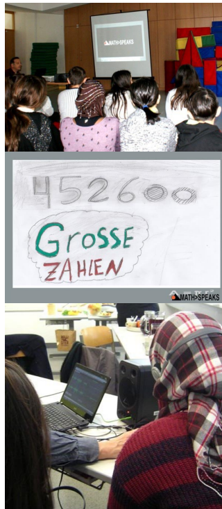
Abb. 7 bis 9: MATH>SPEAKS

Die Workshops zum Projekt MATH>SPEAKS wurden von Kulturkontakt Austria und von der Kulturabteilung der Stadt Wien (MA7) unterstützt.