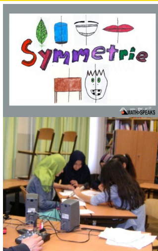
Abb. 4 bis 6: MATH>SPEAKS

Im folgenden MATH>SPEAKS-Auszug erfanden 13-14jährige SchülerInnen (vorwiegend mit Fluchterfahrung), die noch über sehr geringe Deutschkenntnisse verfügten, selbstständig einen Text zum Thema Rechteck, den sie mit verschiedenen Stimmen aufgenommen haben. SchülerInnen eines Sprachförderkurses an der Neuen Mittelschule Obere Augarten-Straße eröffneten im Herbst 2016 ihre Kurzsendung mit diesem Beitrag