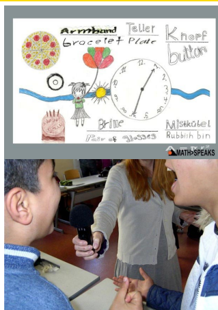
Abb. 1 bis 3: MATH>SPEAKS